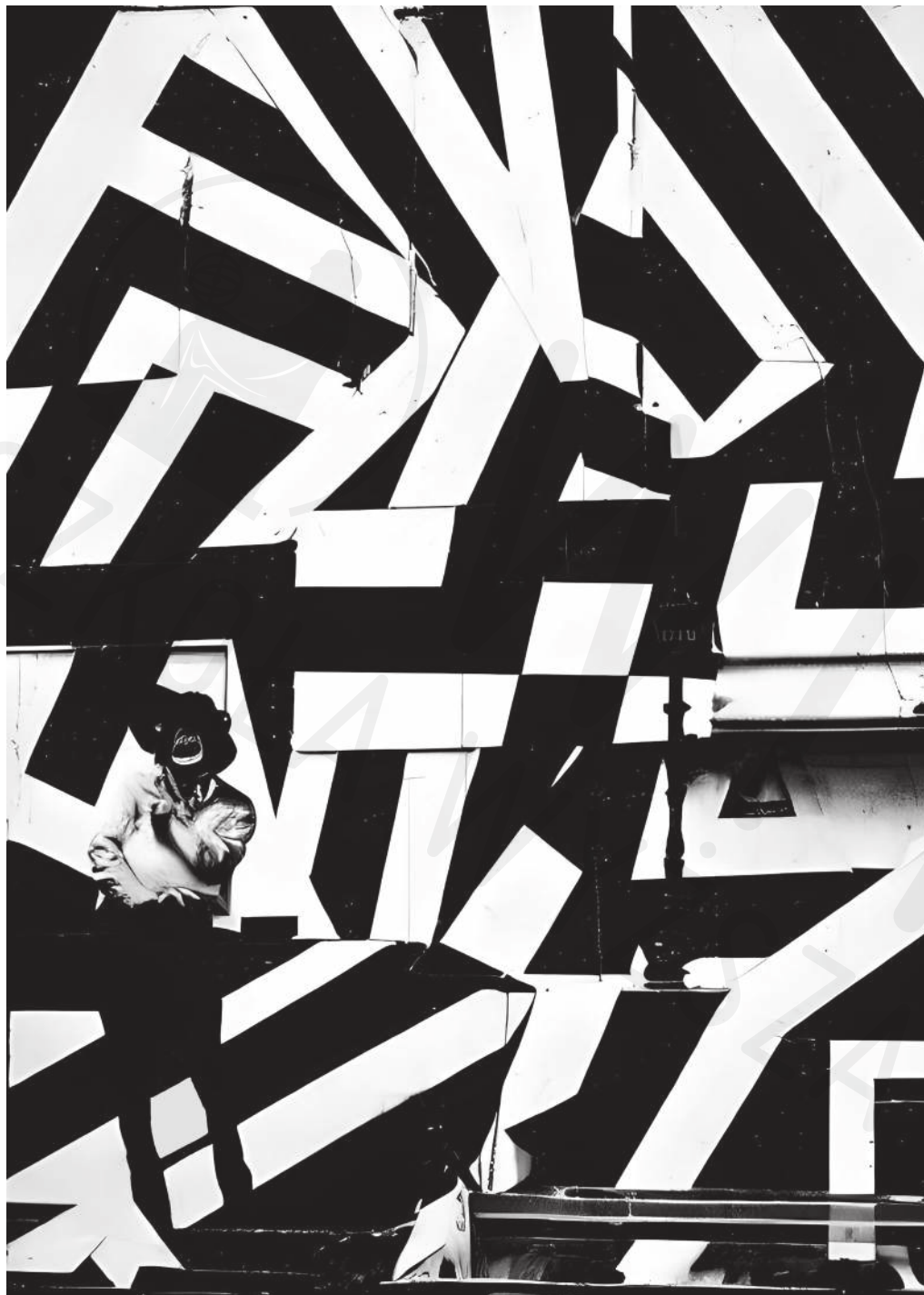
Ekspresja 4 druk cyfrowy 100 x 70 cm 2023